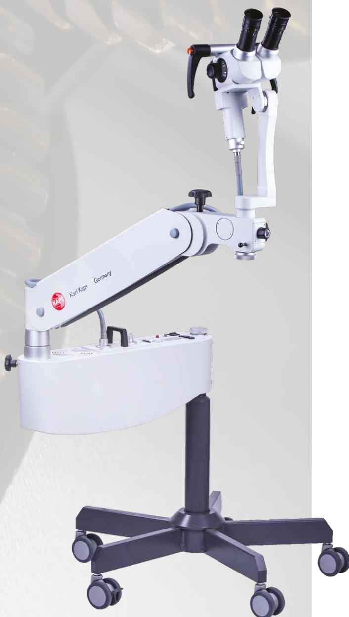
Kaps SOM 52 с наклонным тубусом на мобильной стойке

Благодаря мобильной стойке SOM 52 может использоваться в любом кабинете. Кольпоскоп Kaps SOM специально адаптирован для повседневной работы на гинекологическом приеме и успешной диагностики и лечения.