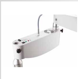
дополнительное светодиодное освещение