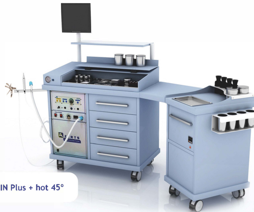
GIN Plus + hot 45°