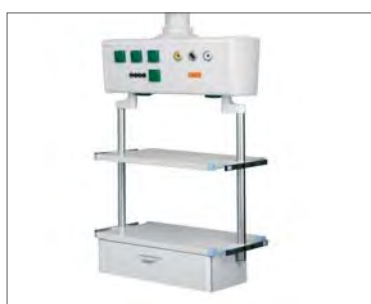
Горизонтальный распределительный модуль, базовая версия