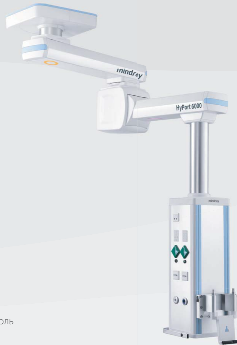
HyPort 6000 моторизованная консоль