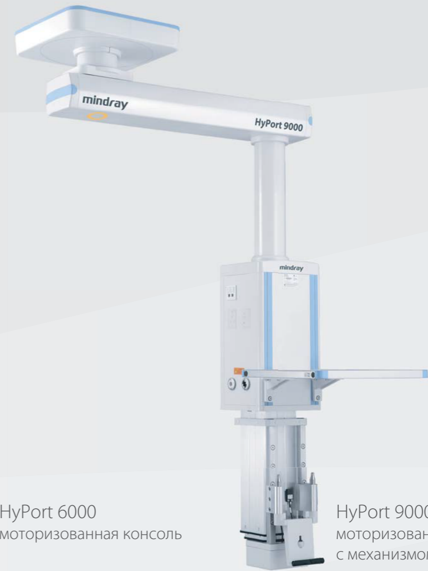
HyPort 9000 моторизованная консоль с механизмом вертикального подъема