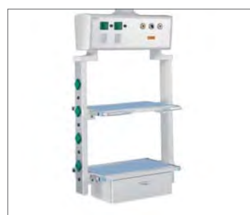
Горизонтальный распределительный модуль, версия «Smart»