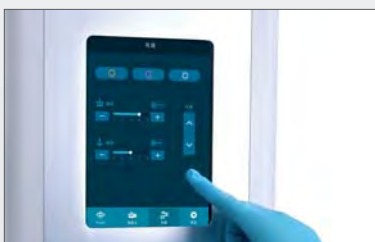
Сенсорная панель управления

Различные средства управления и идентификация тормозов обеспечивают легкость в использовании и интуитивно понятное управление.