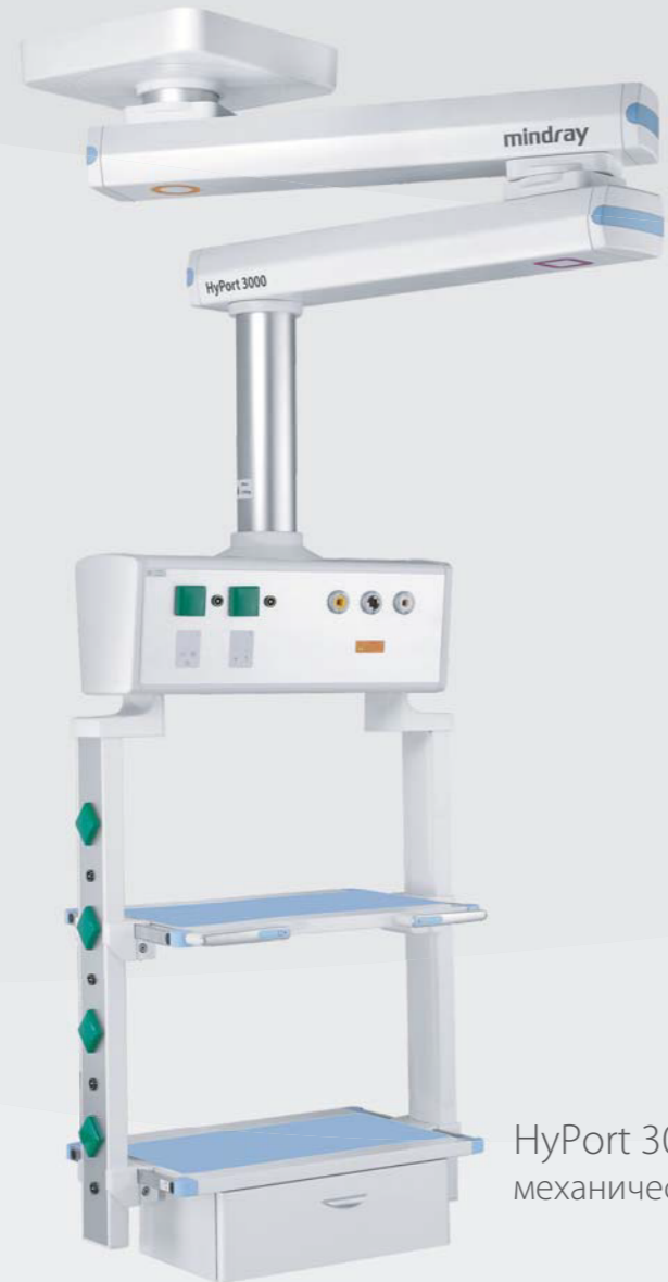
HyPort 3000 механическая консоль

Новое поколение медицинских потолочных консолей