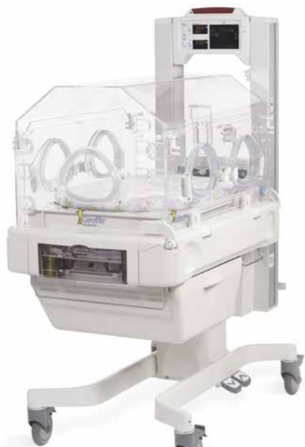
Инкубатор интенсивной терапии для новорожденных Giraffe INC

Сочетание передовых технологий, инновационного дизайна и исключительных функций температурного контроля позволяет реанимационным системам семейства Giraffe создать условия, благоприятные для поддержания жизни новорожденных, их выхаживания, роста и здорового развития. Реанимационные системы семейства Giraffe упрощают и стандартизируют медицинскую помощь, а также помогают достичь положительных конечных исходов при выхаживании больных детей, учитывая при этом потребности медперсонала и членов семьи.