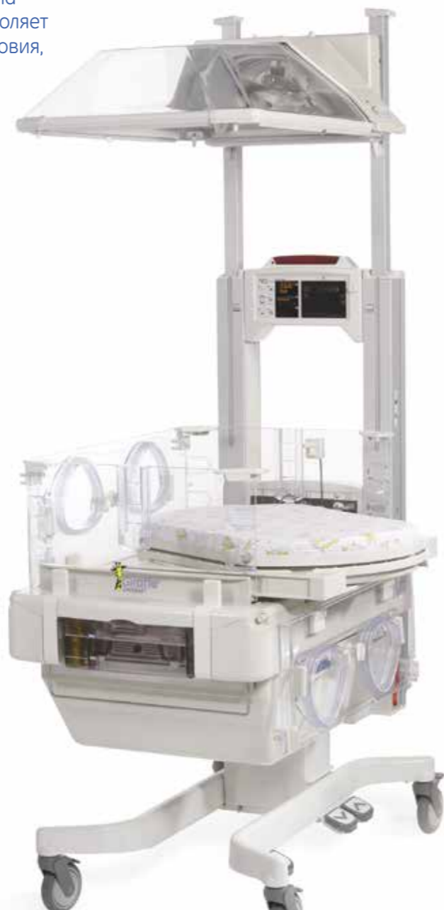
Реанимационная система для новорожденных Giraffe Omnibed