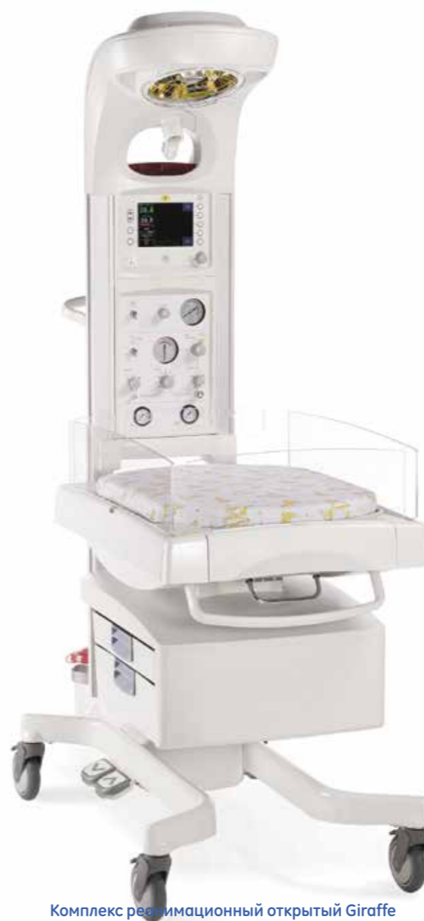
Комплекс реанимационный открытый Giraffe