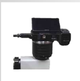
HD-фотоадаптер для Sony