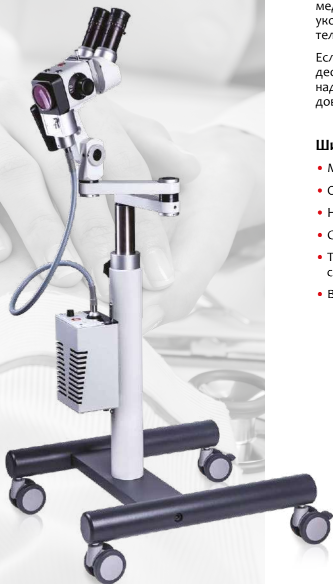
Карс КР 3000 с наклонным тубусом на мобильной стойке

Карс КР 3000 – идеальный кольпоскоп для каждодневных рутинных обследований. Совместно с дополнительными аксессуарами он отвечает высоким стандартам качества при привлекательной цене.