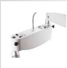
дополнительное светодиодное освещение