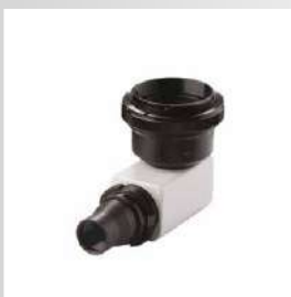
Фототубус для DSLR камеры