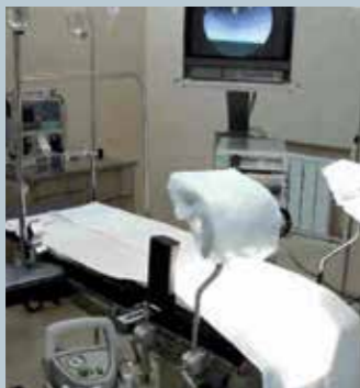
Обычное рабочее место врача-гинеколога

С более чем 120-летним опытом в медицинской технике ATMOS предлагает Вам самую новейшую концепцию в вопросе оснащения рабочего места.