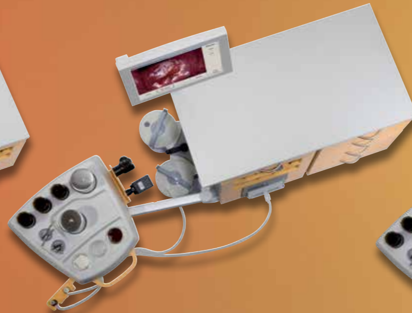
ATMOS® S 41 Gyne– Базовый модуль (Дво́йной)