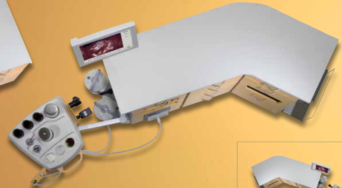
ATMOS® S 41 Gyne – Базовый модуль (Тро́йной, угловой)