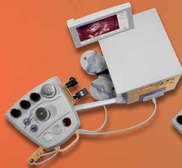
ATMOS® S 41 Gyne – Базовый модуль (Оди́нарный)