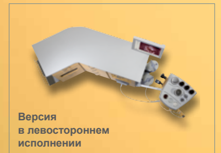
Версия в левостороннем исполнении

Все основные модули в стандартной комплектации содержат рабочую поверхность, маленький выдвижной ящик и ножки с возможностью нивелировки.