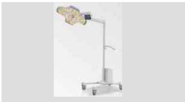
Передвижной светодиодный хирургический светильник HyLED X9M