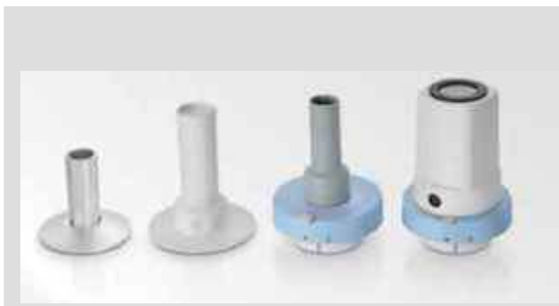
Несколько типов рукояток