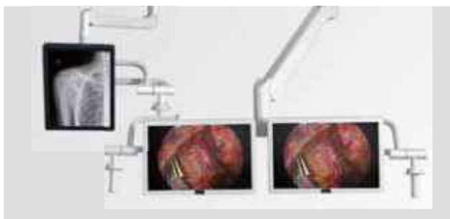
Система с несколькими экранами