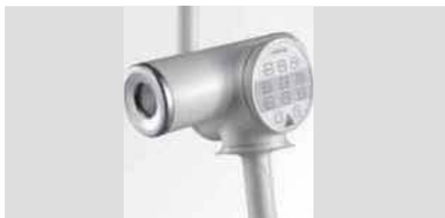
Система камер 4K