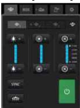
Настенный блок управления