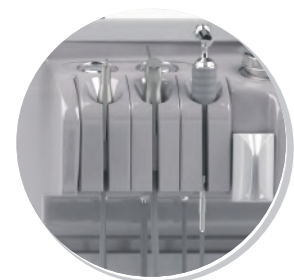
АСПИРАТОР, ПИСТОЛЕТ ДЛЯ ПРОМЫВАНИЯ УША, РУКОЯТКА РАСПЫЛИТЕЛЕЙ