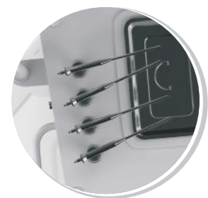
РАСПЫЛИТЕЛИ ЛЕКАРСТВЕННЫХ СРЕДСТВ