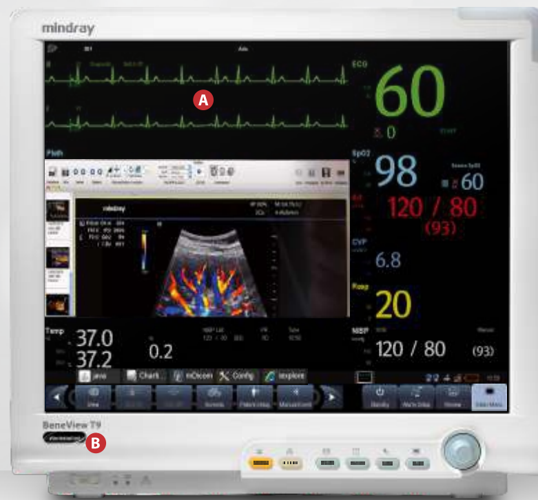
Монитор пациента BeneView T9